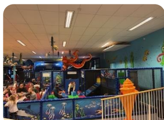
Espace jeux enfants